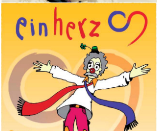
Dr. Patch Adams