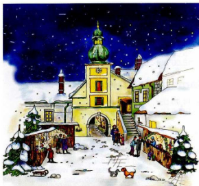
Grafik: Kulturreferat Gemeinde Kottingbrunn