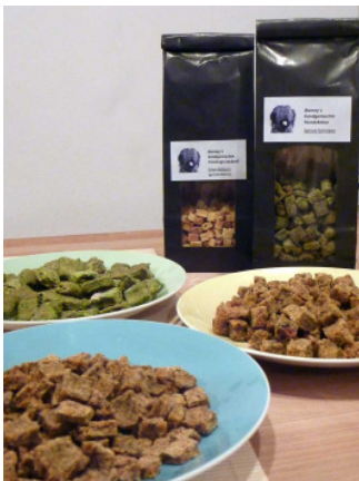
Grafik: © barneys

Für diesen Eintrag wurden 15 Euro an Nachbar in Not für die Erdbebenopfer in Haiti gespendet Vielen Dank!