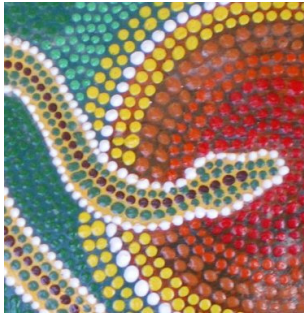
Grafik: © Mag. Ch. Mürwald